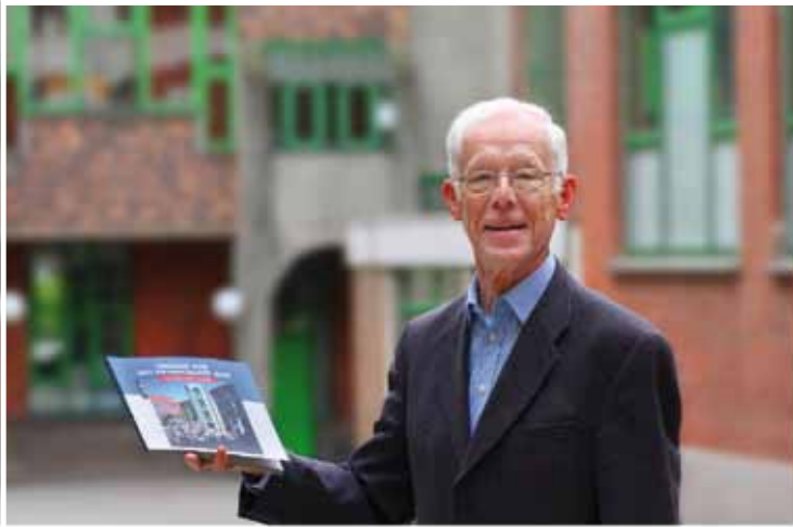
Ik ben Hugo uit Wemmel en geboren in Merchtem. Ik ben oud-leraar en nog steeds actief in het Vlaamse verenigingsleven in Wemmel.

Photo of Marc De Baat 010 28 2020