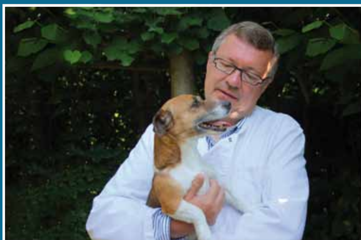
Ik ben Guido uit Wemmel en geboren in Schaarbeek. Ik ben gepassioneerd door dieren, de natuur, teunis en de jaarmarkt van Wemmel.

Wemmel / Studio De Bont Foto: G. Bont © Studio De Bont