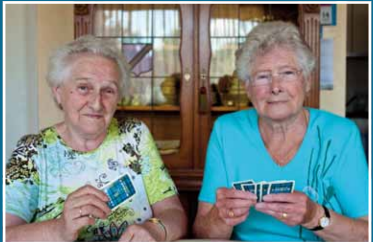
Wij zijn Jeanne en José uit Wemmel en wij zijn geboren in Wemmel. Wij zijn een tweeling en wij spelen graag met de kaarten.

Photo of Marc De Baat 010 28 2020