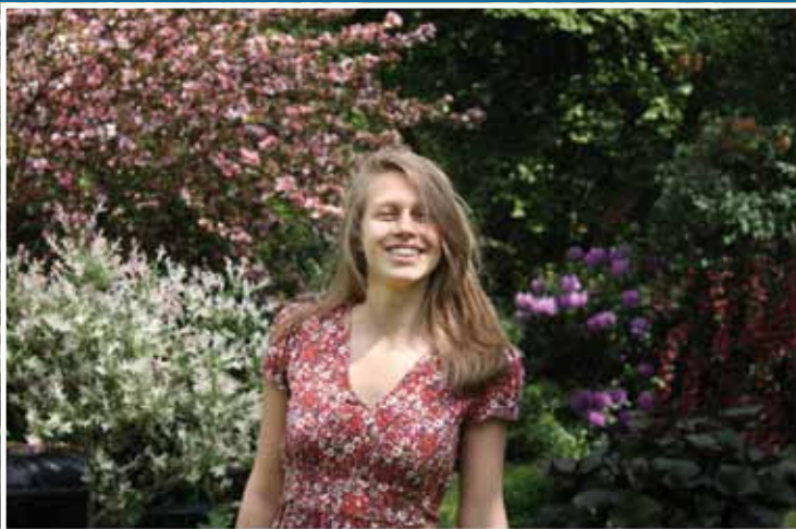
Ik ben Jolien uit Wemmel, geboren in Brussel. Ik geniet van het studentenleven in Leuven maar het is ook heerlijk om thuis te komen!

Photo of Marc De Baat 010 28 2020