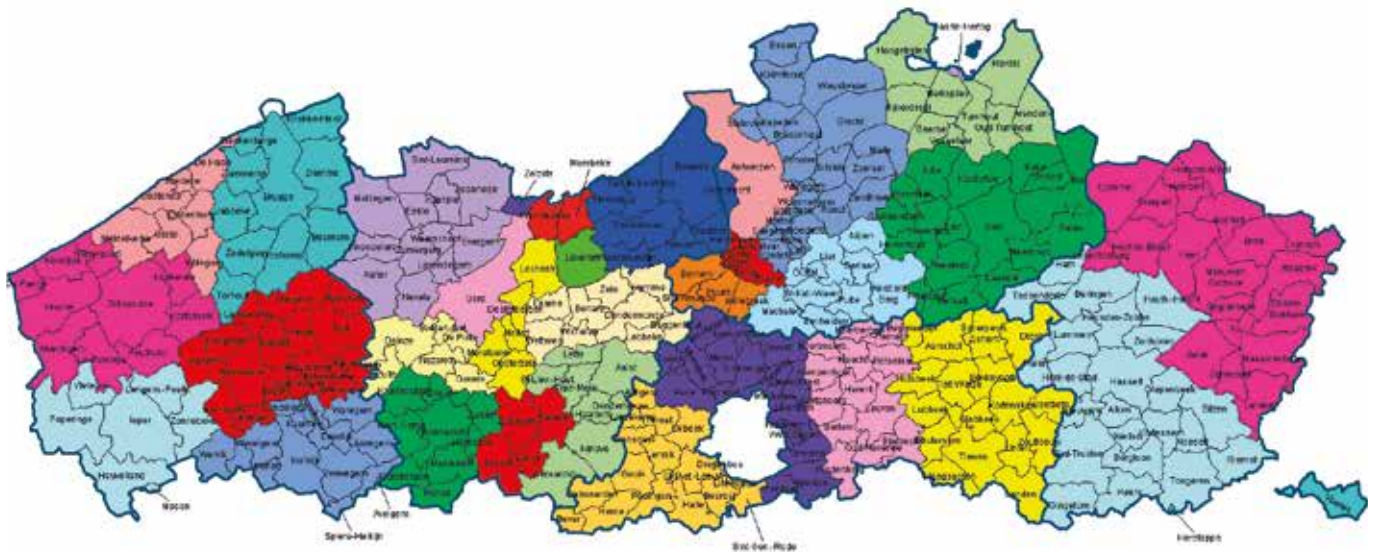
Clusters van gemeenten die minstens 50% dezelfde samenwerkingsverbanden delen.