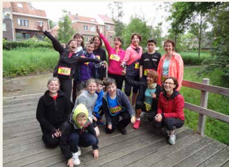
Deelnemers start-to-run van 0 naar 5 km, voorjaar 2014

Volwassenen en kinderen vanaf 10 jaar zijn vanaf 16 september welkom om deel te nemen aan een nieuwe start-to-runsessie van 0 tot 5 km. In 10 weken tijd bouwen we training per training op naar ons einddoel. We lopen elke dinsdag en donderdag om 19.30 uur, en elke zaterdag om 9 uur. Afspraak aan café Fame X, op de hoek van de Dries en de Parklaan.