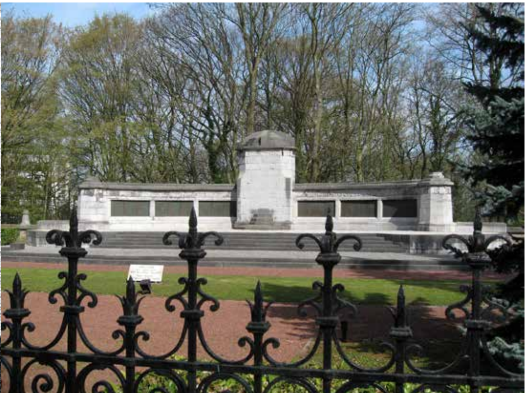
Militair kerkhof Ougrée

In 2014 is het 100 jaar geleden dat de Eerste Wereldoorlog uitbrak. Overal in het land vind je tentoonstellingen of activiteiten ter nagedachtenis van de Grote Oorlog. In de zandloperkrant houden we de herinnering levend door je de komende maanden een overzicht te geven van Wemmelaars die stierven in volle strijd. Straten in Wemmel werden naar deze oorlogshelden genoemd.