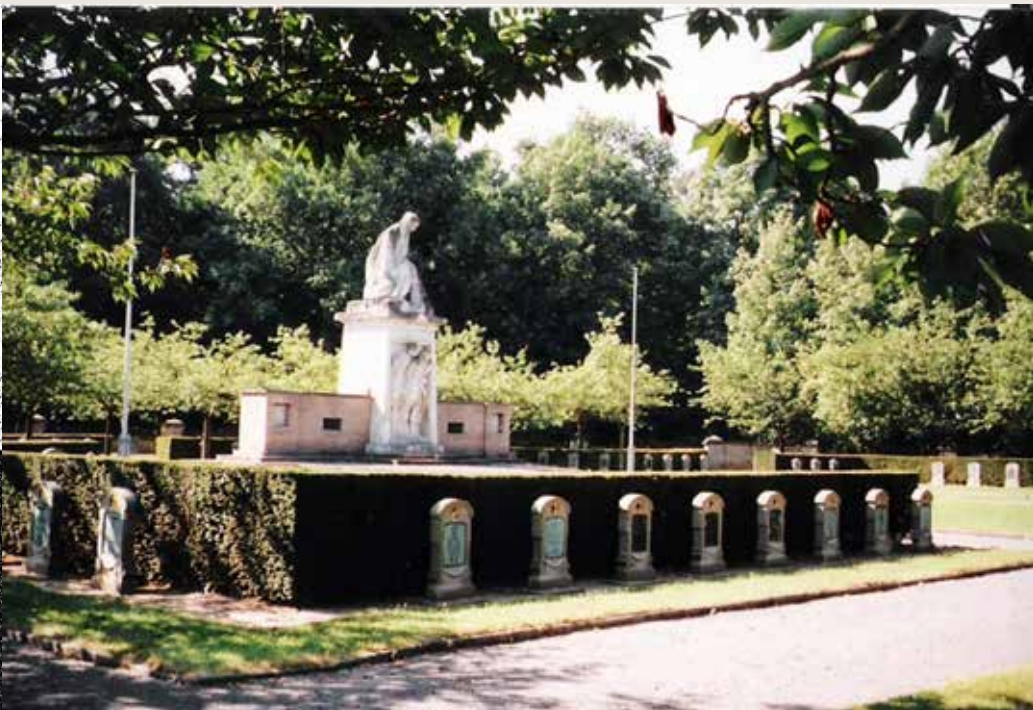
Kerkhof van Champion