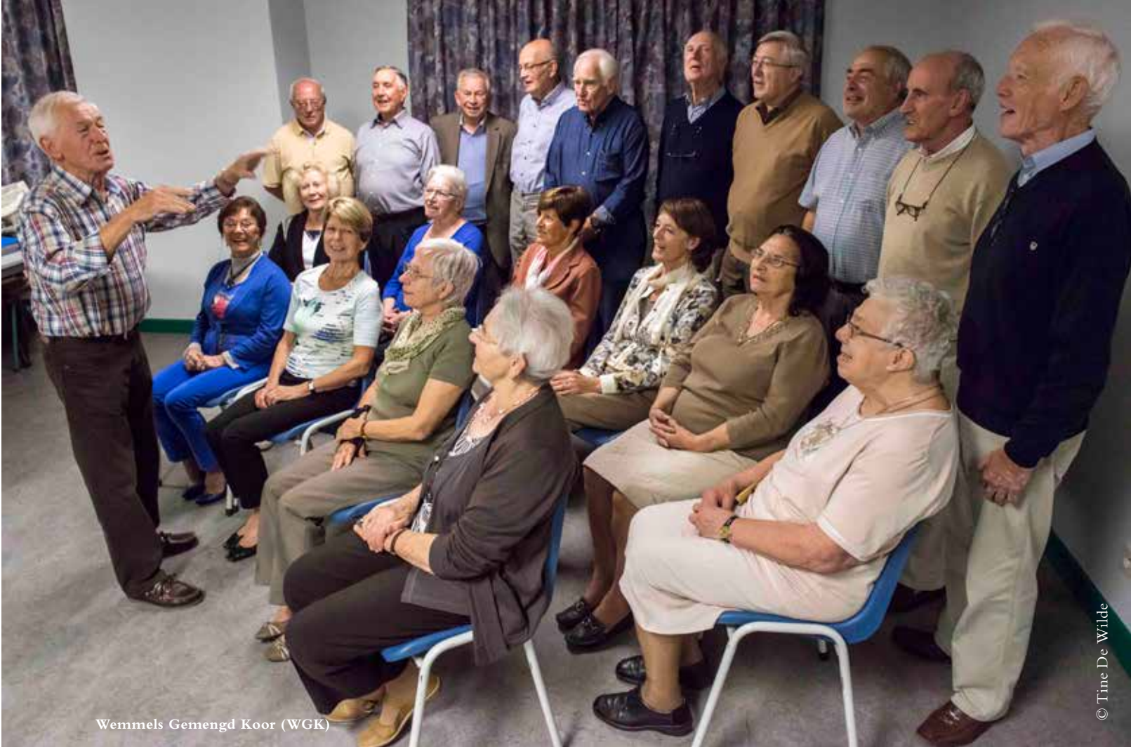
Wemmels Gemengd Koor (WGK)