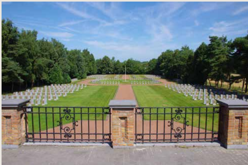
Kerkhof van Veltem-Beisem