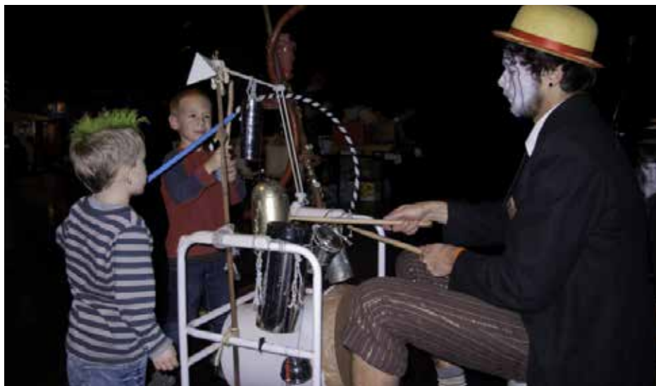
Sfeerbeeld Zotte Zondag, een samenwerking tussen de gemeente en GC de Zandloper.