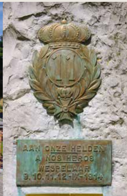
Gedenkplaat voor het 11e linieregiment aan de kerk in Wespelaar