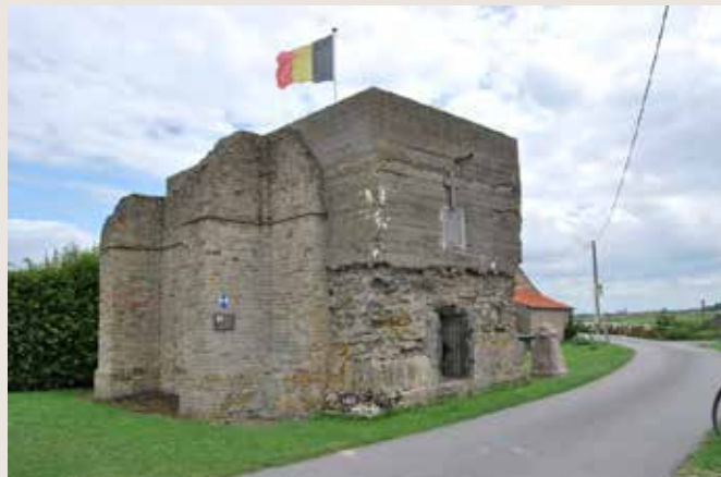
Belgische voorpost in Stuivekenskerke.

Vanaf eind 1914 wordt elke legerdivisie verantwoordelijk gesteld voor een sector aan het Belgische front. Naarmate de oorlog vordert neemt de lengte van het Belgische front toe. Eind 1914 loopt het front van Nieuwpoort tot Diksmuide. Geleidelijk aan schuift de grens op naar Ieper. De totale lengte van het Belgische front gaat van net iets meer dan 10 km naar bijna 40 km in 1918.