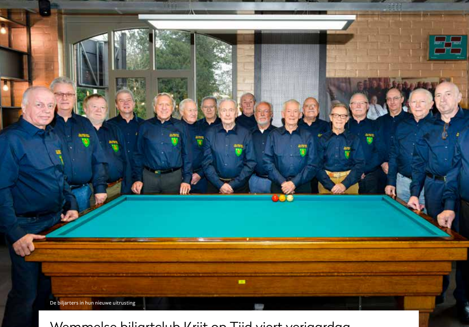
De biljarters in hun nieuwe uitrusting