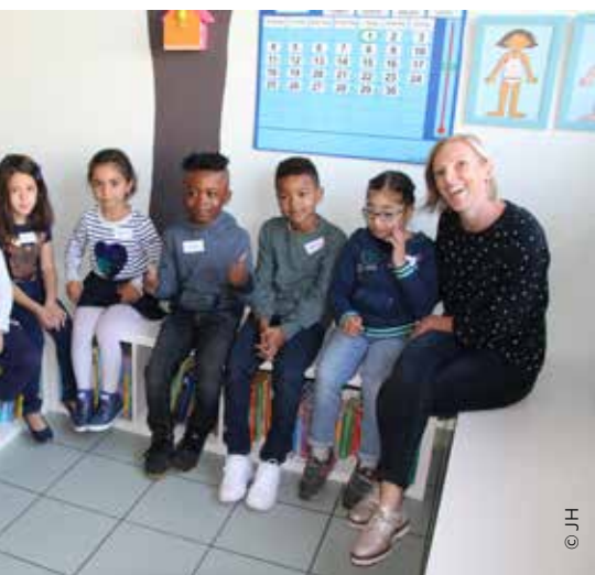
Het eerste leerjaar