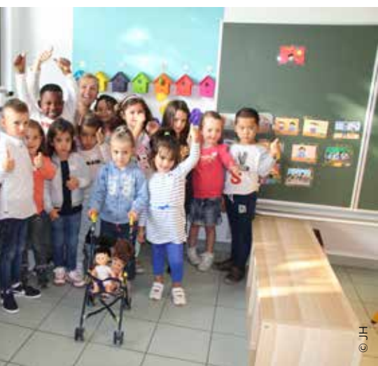
De oudste kleuters

mijn 17e de eerste klant via AVO-Wemmel. Ik ben er nu 63. In het Hooghuis was het altijd volle bak ambiance. Heel veel Wemmelaars zijn op deze plek uit beginnen te gaan en dronken er hun eerste pint. Nostalgie troef.' Of het Hooghuis nog hetzelfde is als vroeger? Dat zullen de klanten bepalen. Die zorgden er immers voor dat het Hooghuis een café met een ziel is. En daar gaan we graag terug naar op zoek ... (JH)