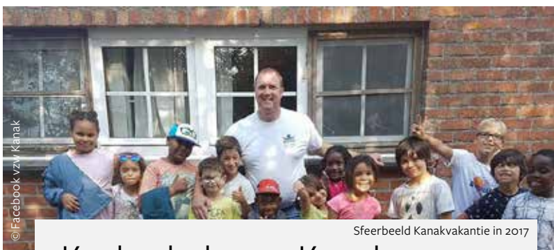
Sfeerbeeld Kanakvakantie in 2017

Naast het fietsnetwerk zal het gemeentebestuur in 2018 werk maken van de verdere uitbouw van de blauwe zone(s). Momenteel zijn er blauwe zones waar je je parkeerkaart moet gebruiken, onder andere aan de Markt, De Ridderlaan, de Residentie ..., maar er komen parkeerzones bij. 'Dat staat in ons beleidsplan om de parkeerdruk vanuit Brussel tegen te gaan. Wemmel zal worden opgedeeld in zones waar er telkens een aangepast parkeerbeleid wordt toegepast. In Bouchout gaan we niet dezelfde maatregelen nemen als bijvoorbeeld in de Albert I-laan, omdat de parkeerdruk er compleet verschilt. De dringendste parkeerzones die we zullen aanpakken, zijn blauwe zones die het dichtst tegen de grens met Brussel liggen.' Een ander belangrijk mobiliteitsaspect in Wemmel is de nabijheid van de grote ring rond Brussel. De Werkvennootschap, die de uitbreiding van de ring coördineert, komt in februari 2018 op werkbezoek in Wemmel. Dan zullen gemeenteraadsleden en inwoners ingelicht worden over de uitbreidingsplannen. Wemmel ijvert voor het afsluiten van de op- en afrit aan de De Limburg Stirumlaan. De bedoeling zou zijn het verkeer van en naar de ring via één groot, nieuw klaverblad ter hoogte van de Bowling Stones in de Brusselsesteenweg te leiden. (JH)