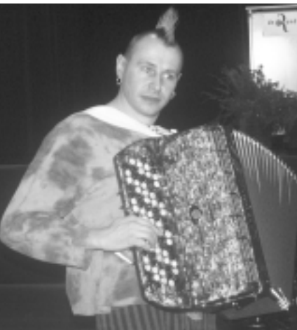
Marino Punk hield er de 'mood' in