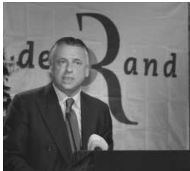
Patrick Dewael: “De faciliteiten moeten uitdoven.”

De taalfaciliteiten zijn een typisch Belgisch compromis. Door in 1963 dit stelsel in te voeren werden de uiteenlopende standpunten in de communautaire strijd verzoend, legde prof. dr. Els Witte uit, en kon de politiek zich verder bezighouden met de sociaal-economische problemen. Voor de Vlamingen was het belangrijk dat het tweetalige Brussel tot de 19 gemeenten beperkt werd en dat de taalgrens vastgelegd werd. De Franstaligen zagen in de faciliteiten een regeling die nauw aansloot bij Brussel om er na verloop van tijd in op te gaan. “De volgende compromissen in de opeenvolgende staats hervormingen gingen verder op dit uitgangspunt, al werd het administratief steeds duidelijker dat de zes faciliteitengemeenten tot het Nederlandstalig gebied behoren. In 1988 werden de faciliteiten grondwettelijk verankerd. Het al