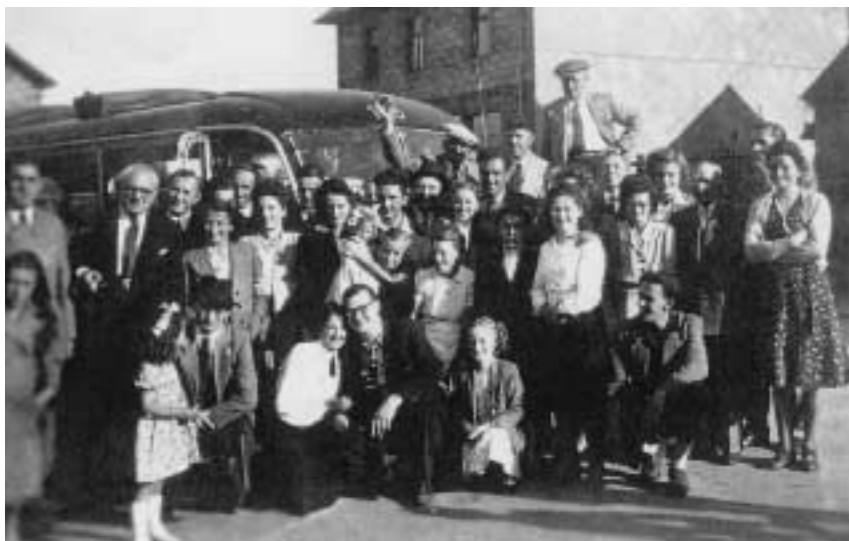
Het Wommels koor op bezoek in Faymonville in 1948

Kaarten voor het concert kunnen verkregen worden bij het bestuur en de muzikanten van de Koninklijke Fanfare Sint-Servaas Wommel en in de cafetaria van GC De Zandloper.