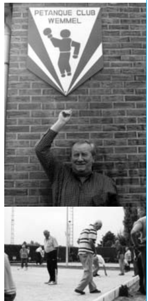
Rara waar is de bal?