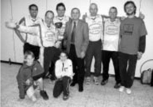
Voetbalclub KVK Wemmel kwam als winnaar uit de bus.