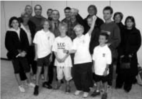
Tennisclub BTC werd verdienstelijk tweede.