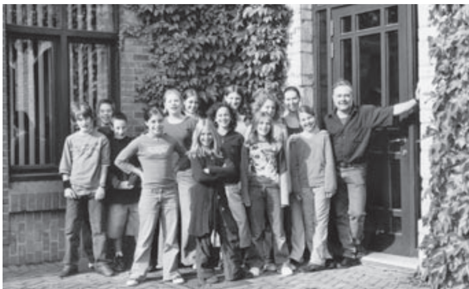
De spelers van K.K.-Toneel.

‘Mogen Doen’, in 1989 uit de Wamblientjes ontstaan, is uitgegroeid tot een ongekend succes. Elke week loopt de Zandloper over van enthousiaste dansers en dansertjes, de grootste groep van ‘Mogen Doen’. “We willen kinderen en jongeren op een gestructureerde manier hun creativiteit laten botvieren. Dat lukt wonderwel. Onze 500 leden zijn elke week enkele uurtjes creatief bezig. Elk jaar gaan we op ‘talentenstage’. Dan hebben we meer tijd om onze ideeën verder uit te werken. Zo werd het toneelgedeelte van ‘Culcreacul’ op de laatste talentenstage op gang gebracht. Ideeën en uitwerking werden voor de eerste keer uitgetest en verfijnd. Nadien