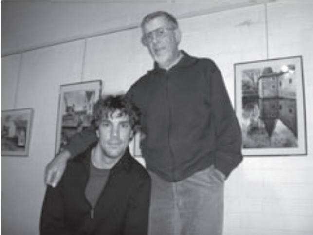
Vader en zoon Van Zeebroek, twee creatieve Wemmelaars.

heb ik er al zo'n 150 en ik weet niet meer waar ik ze kwijt moet raken. Ik heb vooral plezier in het maken van een werk; daarna kijk ik al uit naar een nieuwe uitdaging. Mijn vrouw zegt dat ik meer schilderijen moet verkopen, 'moa ik zen giene verkuuper', vertelt de schilder in zijn sappig Brussels accent. "Dat accent zal nooit verdwijnen. Ik ben een echte Brusselaar. Ik ben in het centrum van Brussel in het 'beddeken van de Zenne' in een kelderkeuken geboren. Ik woon al sinds 1965 in Wemmel. Maar mijn Brussels accent zullen ze me nooit afnemen. Er wordt trouwens veel te weinig dialect gesproken. Om mee te helpen het dialect levend te houden, heb ik me aangesloten bij de Academie van het Brussels Dialect. Dialect is in feite zeer duidelijk en direct en dat zou niet verloren mogen gaan."