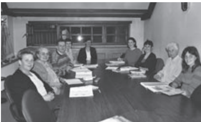
De minister maakt meer geld vrij voor taalpromotie in de rand.

De klemtoon ligt op onderwijs en werk. Er komt een ruimere ondersteuning van basisscholen in de Vlaamse rand die heel wat anderstalige leerlingen in hun midden hebben. Extra leerkrachten moeten ervoor zorgen dat de taalvaardigheid, zowel het spreken als het schrijven, van anderstalige leerlingen verbetert. 91 extra voltijdsen worden ingezet. Ook in bedrijven worden vier extra instructeurs Nederlands aangesteld om taallessen te geven die gericht zijn op het taalgebruik op de werkvloer. Ook voor vzw 'de Rand' valt er nieuws te rapen in de beleidsbrief. Zo wordt er geld vrijgemaakt om de Boesdaalhoeve in Sint-Genesius-Rode te kopen, zodat ze als een volwaardig gemeenschapscentrum gebruikt kan worden. Tot nu toe was de hoeve eigendom van het gemeenschapsonderwijs en organiseerde de Erasmushogeschool er haar musicalopleiding. Verder wordt het gemeenschapscentrum de Muze in 2006 operationeel. Het meest in het oog springt echter de bijkomende opdracht inzake 'taalpromotie' die 'de Rand' krijgt. De minister gaat er terecht van uit dat taalonderwijs en taalsensibilisering bij uitstek bijdragen tot de integratie van anderstaligen, van welke afkomst of sociale achtergrond ze ook zijn. Hij wil van taalpromotie een prioritair aandachtspunt maken. De realisatie ervan