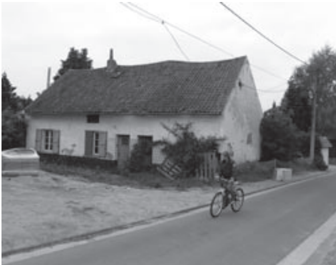
Deze typische 19de-eeuwse hoeve in de Van der Vekenstraat is wel mooi, maar niet 'uniek' genoeg om te laten beschermen.