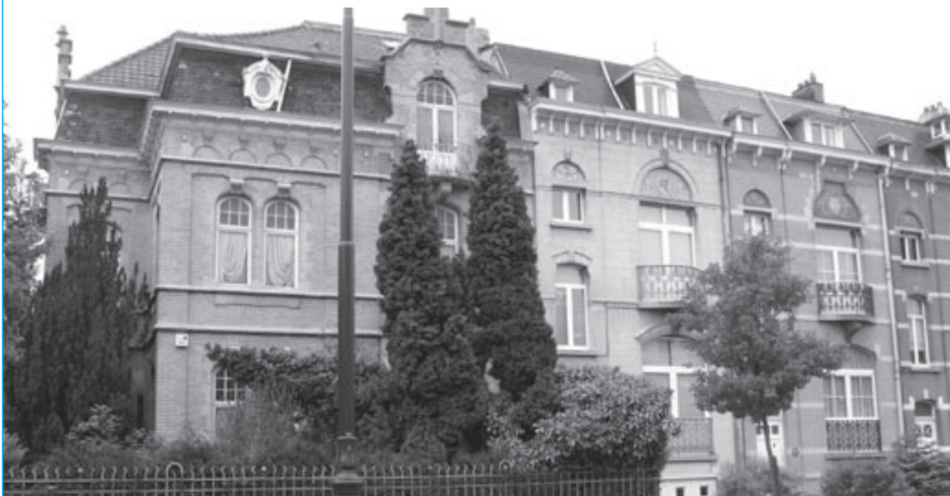
De rijwoningen in de Limburg Stirumlaan dateren van het begin van de vorige eeuw en werden opgenomen in de inventaris van Monumenten en Landschappen.