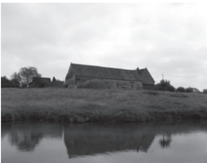
De Ronkelhoeve: de enige hoeve in Wemmel die omwille van de typische stijl kan worden beschermd.

De inventaris van het erfgoed in Wemmel wordt eind dit jaar door Monumenten en Landschappen voorgesteld. De gegevens zijn binnenkort te raadplegen op: www.monument.vlaanderen.be