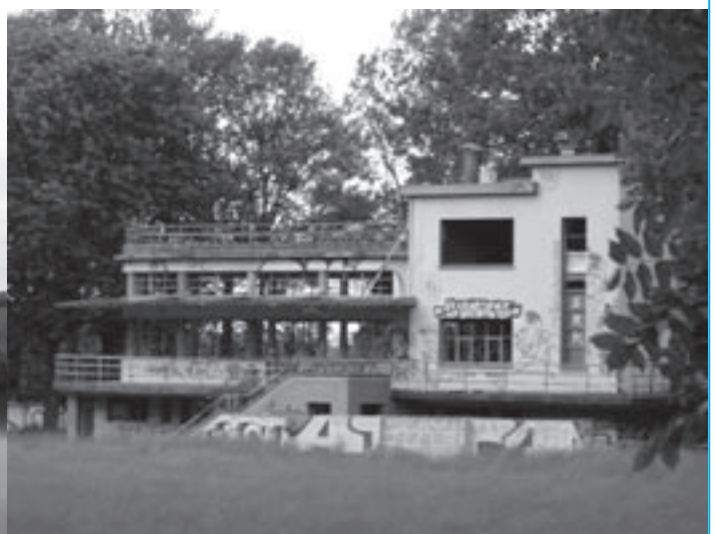
Het 'boothuis' van Saint-Michel komt wel in aanmerking om te worden beschermd.