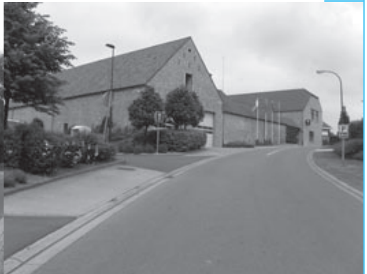
De Drieshoeve is compleet verbouwd tot politiehuis en kan dus niet meer worden beschermd.

bestaande worden opgetrokken. Momenteel ligt de bouwdruk zo hoog dat enkele ontwikkelaars tegen 500 euro per vierkante meter bouwgrond kopen om er appartementen op te zetten."