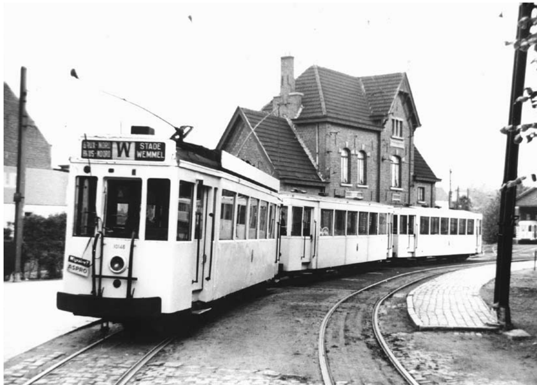
De vroegere tramstatie. Over de onteigening van de gronden loopt een jarenlang proces met De Lijn.

Om ideologische en communautaire redenen laat de gemeente bovendien ettelijke miljoenen links liggen. Zo bekostigt ze bijvoorbeeld de uitbreiding van de Franstalige school van zo'n miljoen euro liever helemaal zelf dan de beschikbare subsidies aan te vragen aan Vlaanderen. Wemmel boort zich hiermee zo'n 750.000 euro door haar eigen neus. Wie betaalt dat? Juist, jij en ik.