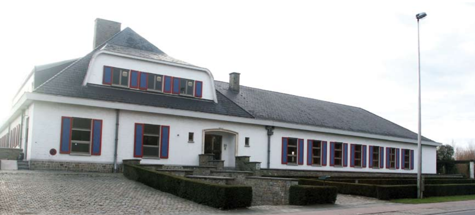
Het sportterrein van Sibelgas aan de Zijp werd door de gemeente voor veel geld aangekocht. Maar om wat mee te doen?

Over de realisatie van het nieuwe containerpark, waarvan de normale werking nog wel even op zich zal laten wachten, rolden de schepenen dan weer over elkaar heen om te bewijzen wie deze prachtige pluim op zijn/haar hoed mocht steken. Een milieuraad kwam er wél, net als de aanzet van een globaal waterbeleid en de strijd tegen de hondenpoep. Toevallig of niet bevoegdheden van de oppositieschepen? Gemeentelijke informatie kreeg