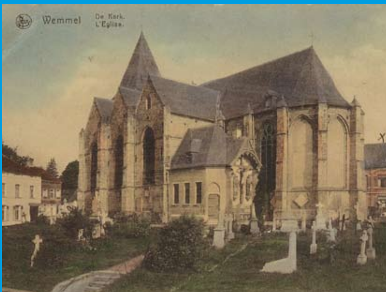
De kerk met kerkhof errond.