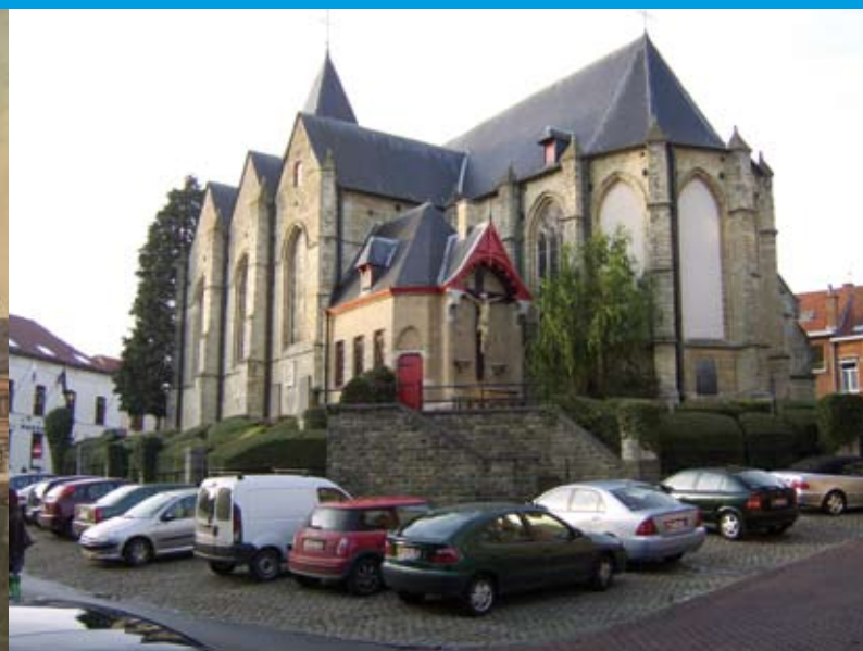
De kerk met auto's errond.