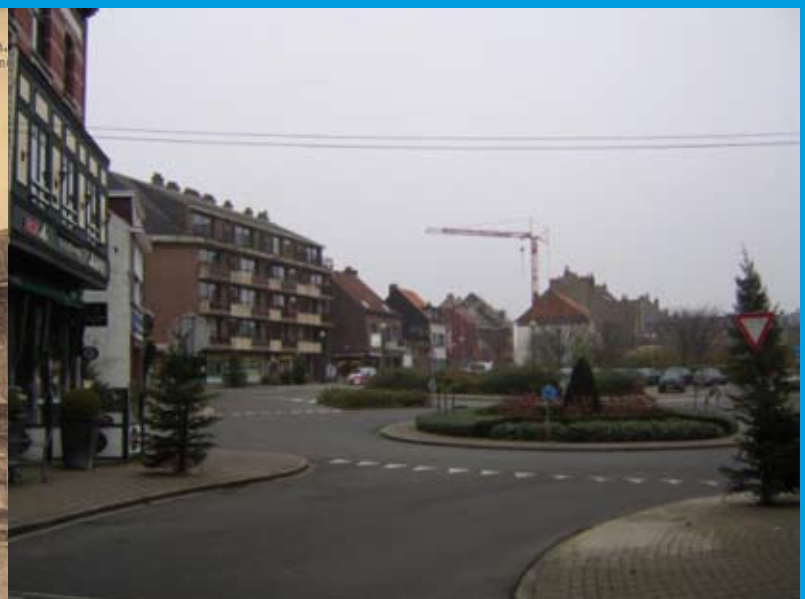
Het rondpunt voor café ‘t Glazen Huis’ zag er vroeger helemaal anders uit. Het oude gebouw waar nu het rondpunt is, deed dienst als gemeentehuis, politiecommissariaat en school.