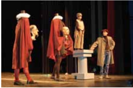
Uit de voorstelling Brussel in billekes, van naa en van de joère stillekes

De Pieterman is de Wemmelse toneelkring die je immuuniteitsysteem versterkt, je slapeloosheid bestrijdt, je algemene fysieke toestand verbetert en je stress doodt. Je hapt naar adem?