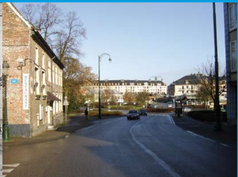
De Kam, nu een Turks restaurant, op het einde van de Limburg Stirumlaan. Vroeger had je uitzicht op de velden; nu op de nieuwe markt. Vroeger passeerde de boerentram er om rechtsaf te draaien naar de tramstation; nu bolt er een bus van de Lijn. Een ‘kam’ was tegelijk een boerderij, stokerij, afspanning en brouwerij. ‘Kam’ of ‘cam’ komt van het hangijzer in de vorm van een kam waaraan brouwketels werden opgehangen.