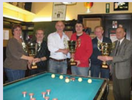
Café Glazen Huis heeft drie wisselbekerwedstrijden voor golfbiljart in het leven geroepen.