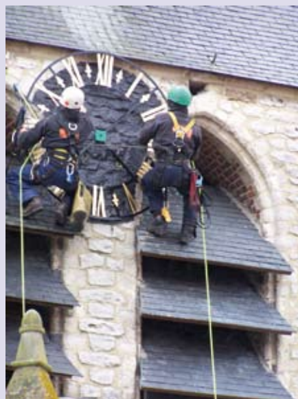
Specialisten hebben de drie wijzerplaten en wijzers van de Sint-Servaaskerk teruggehangen.