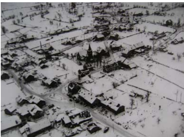
Het dorpje Faymonville nabij Malmedy werd tijdens het Von Rundstedt-offensief platgebombardeerd.