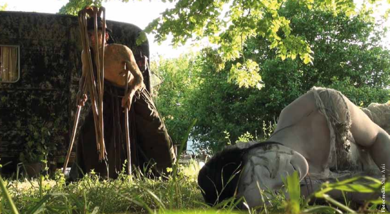
Fotocredit: Shim Arai