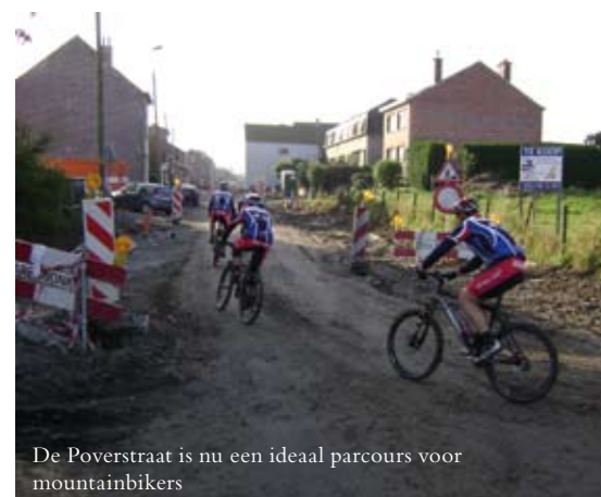
De Poverstraat is nu een ideaal parcours voor mountainbikers