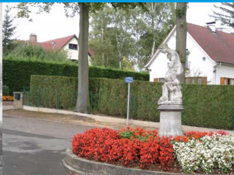
Het beeldje dat vroeger voor het verdwenen 'I Jzeren kasteel' stond, staat nu aan de Haagdoornlaan - Parklaan.