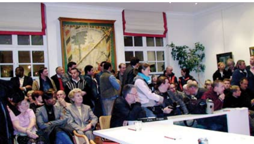
Een vol huis voor de gemeenteraad van 22 oktober in Linkebeek. Niet om belangrijke beslissingen over de gemeente te vernemen; wel omdat er Frans werd gesproken.

zogenaamd tweetalige ziekenhuizen tonen aan hoe moeilijk het is om mensen tot in de privé sfeer te verplichten een taalwet te respecteren. Het gaat dus uiteindelijk om de verantwoordelijkheid die ieder individu in zijn houding tegenover de andere opneemt of niet wil opnemen.