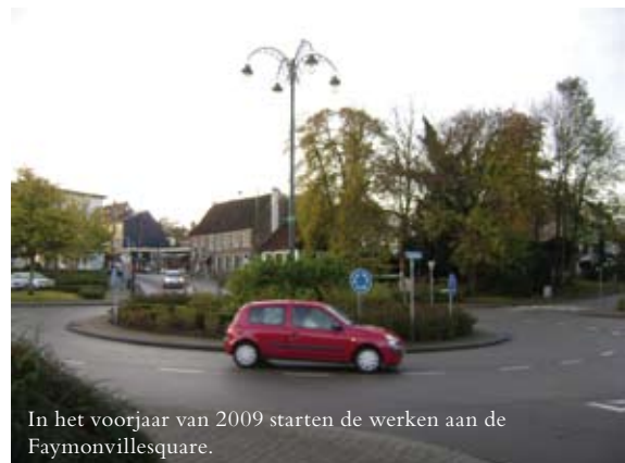
In het voorjaar van 2009 starten de werken aan de Faymonvillesquare.