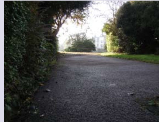
Aan de ingang van het park zouden veel jongeren rondhangen die joints roken en ruzie maken.