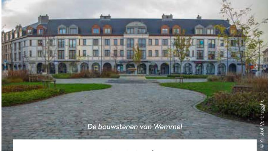
De bouwstenen van Wemmel

tickets: 20 euro (basisprijs), 18 euro (ABO) & 10 euro (jongerentarief -21)