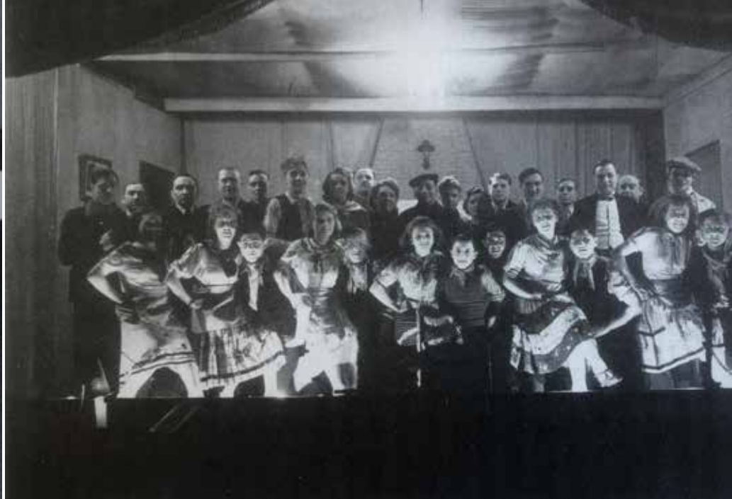
Toneelgroep 'Willen is kunnen' bij de repetities van 'Boerenbloed' in zaal Pax. Uit: Wemmel, een dorp tussen grootstad en platteland van Christian Andries

Die grootvader heette Van Roy. Hij was een handelaar in bloem, en ook de broer van architect Van Roy, die voor de oorlog al veel huizen had getekend in Wemmel. 'Mijn grootvader, en later mijn moeder, verhuurden het hele gebouw in de Schoolstraat. Wie het café huurde, verhuurde dan op zijn beurt de zaal en de kleine appartementen op de verdiepingen door.'